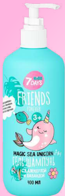
КАЛЕНДУЛА + ЛАВАНДА