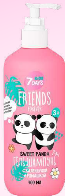
КАЛЕНДУЛА + РОМАШКА