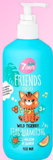
МЕД + ДЫНЯ