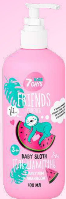
АРБУЗ + АНАНАС